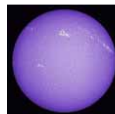
Soleil, vu à travers la raie du Calcium

Grace à des télescopes et spectroscopes, vous pourrez observer le Soleil et les molécules qui le composent, et comprendre la formation, la vie et la mort des étoiles.