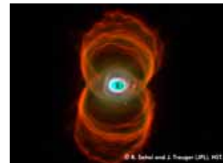
La nébuleuse du Sablier

Cet atelier sera aussi l'occasion d'organiser des discussions autour des métiers de l'astrophysique et d'expliquer en quoi consiste ce métier aujourd'hui.