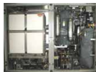
Système de pile à combustible et reformage

Les deux premières visites sont liées et s'enchaînent.